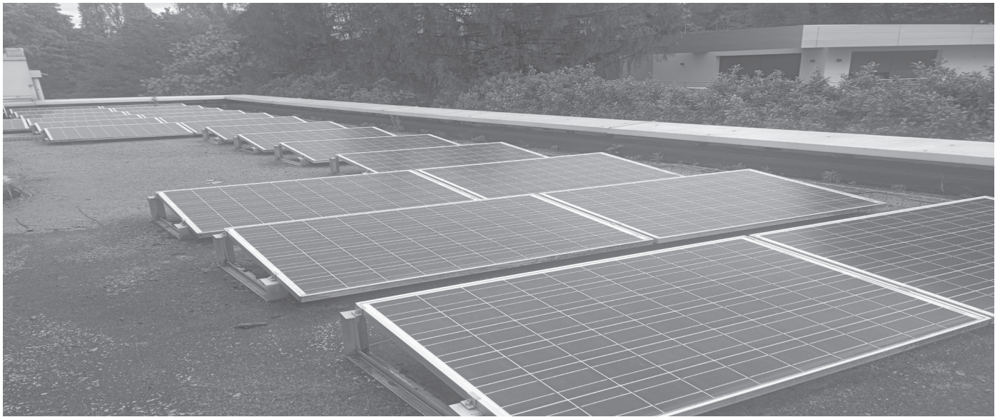
In corso i lavori di installazione delle batterie accumulatrici dell'energia prodotta