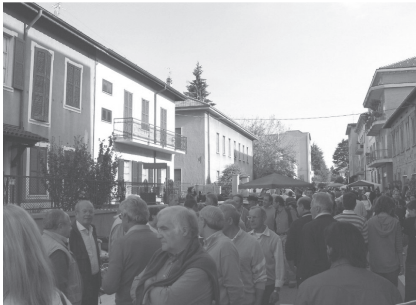
C'era una volta l'Ottobre Carughese...